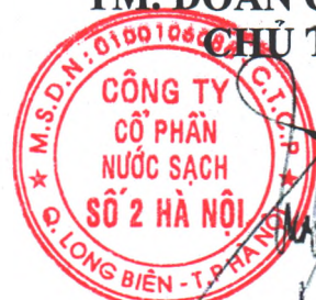
Dương Quốc Tuấn